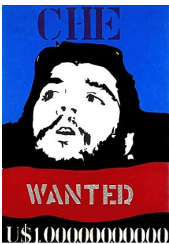
Che Guevara, 1967.

Rubens Gerchman foi um pintor, desenhista, escultor e gravador carioca, considerado por alguns críticos como representante brasileiro do movimento Pop Art .